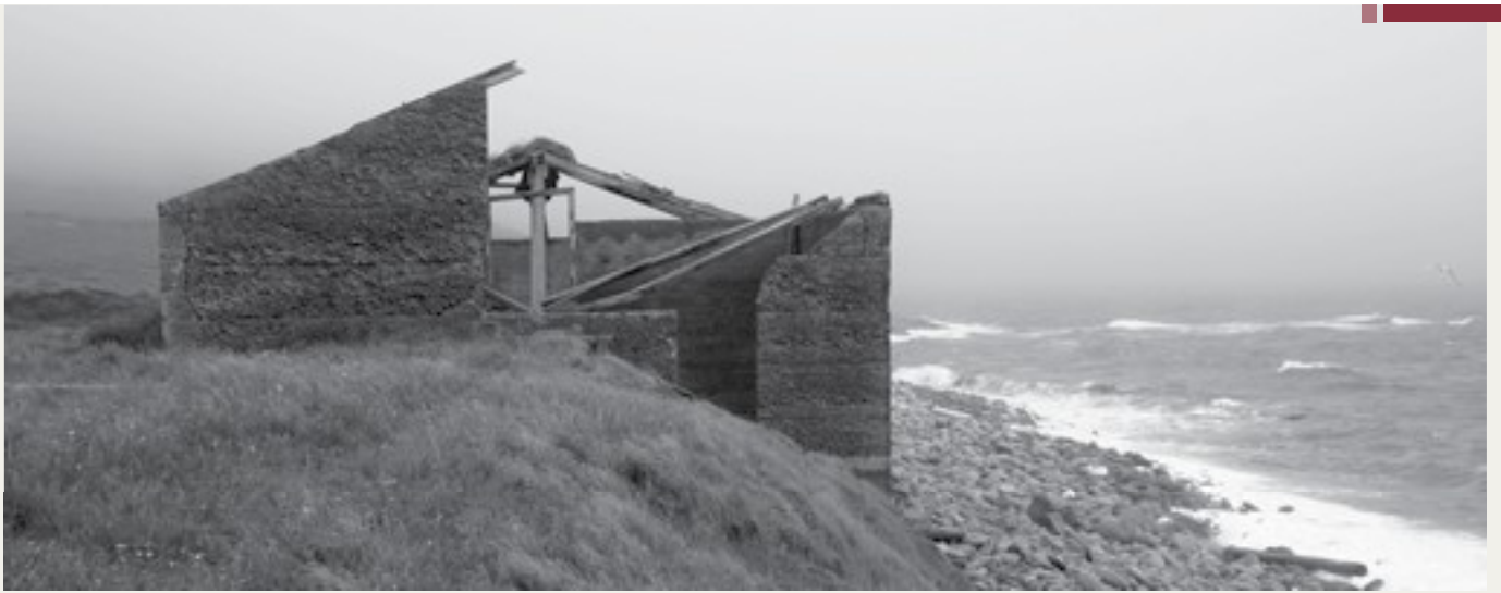
Willem van Blijderveen.