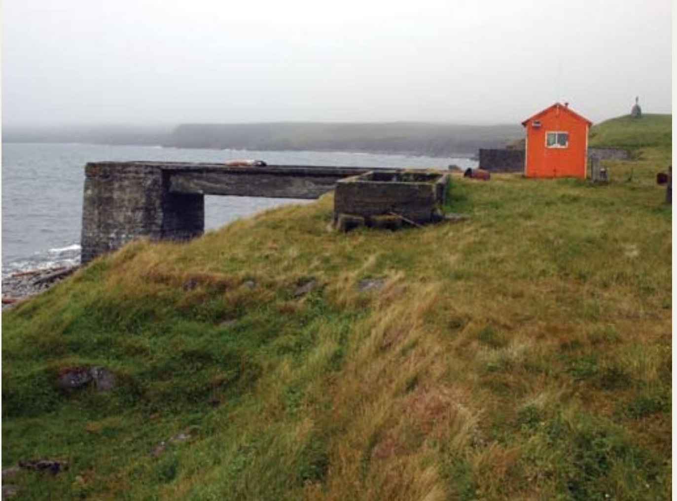
Willem van Blijderveen.